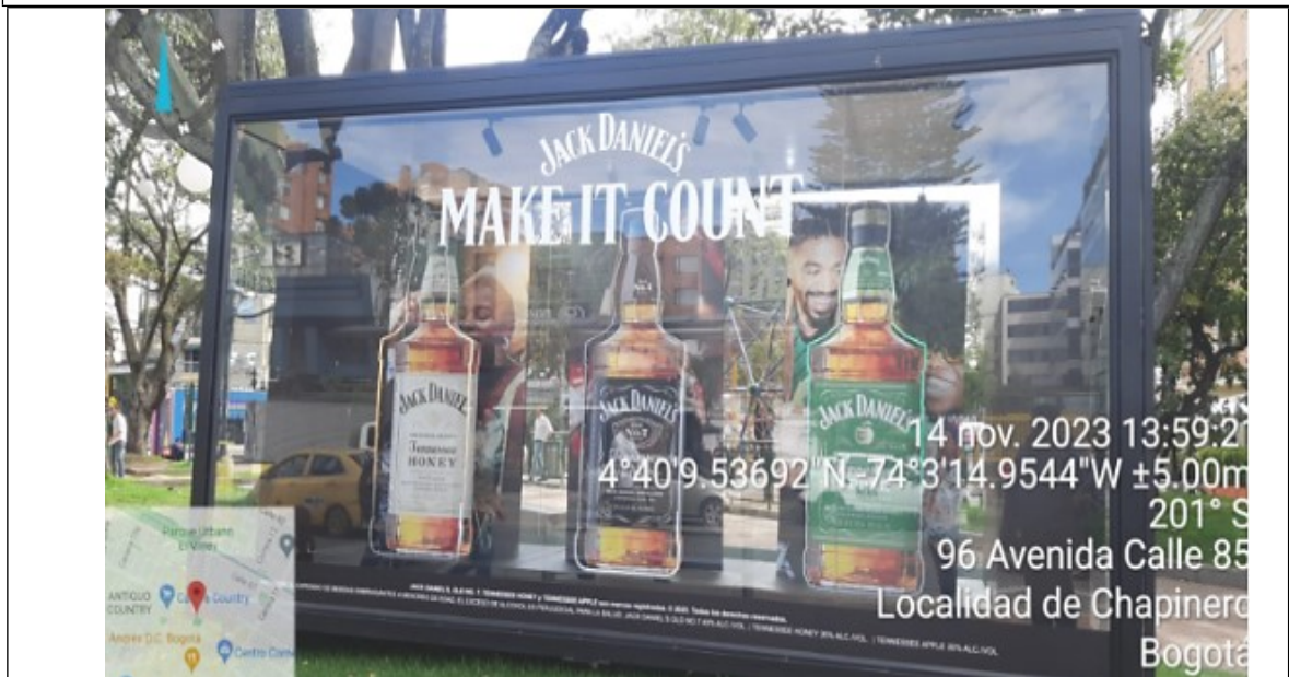
En la cual se observa la publicidad encontrada, ubicada en área que se constituye espacio público